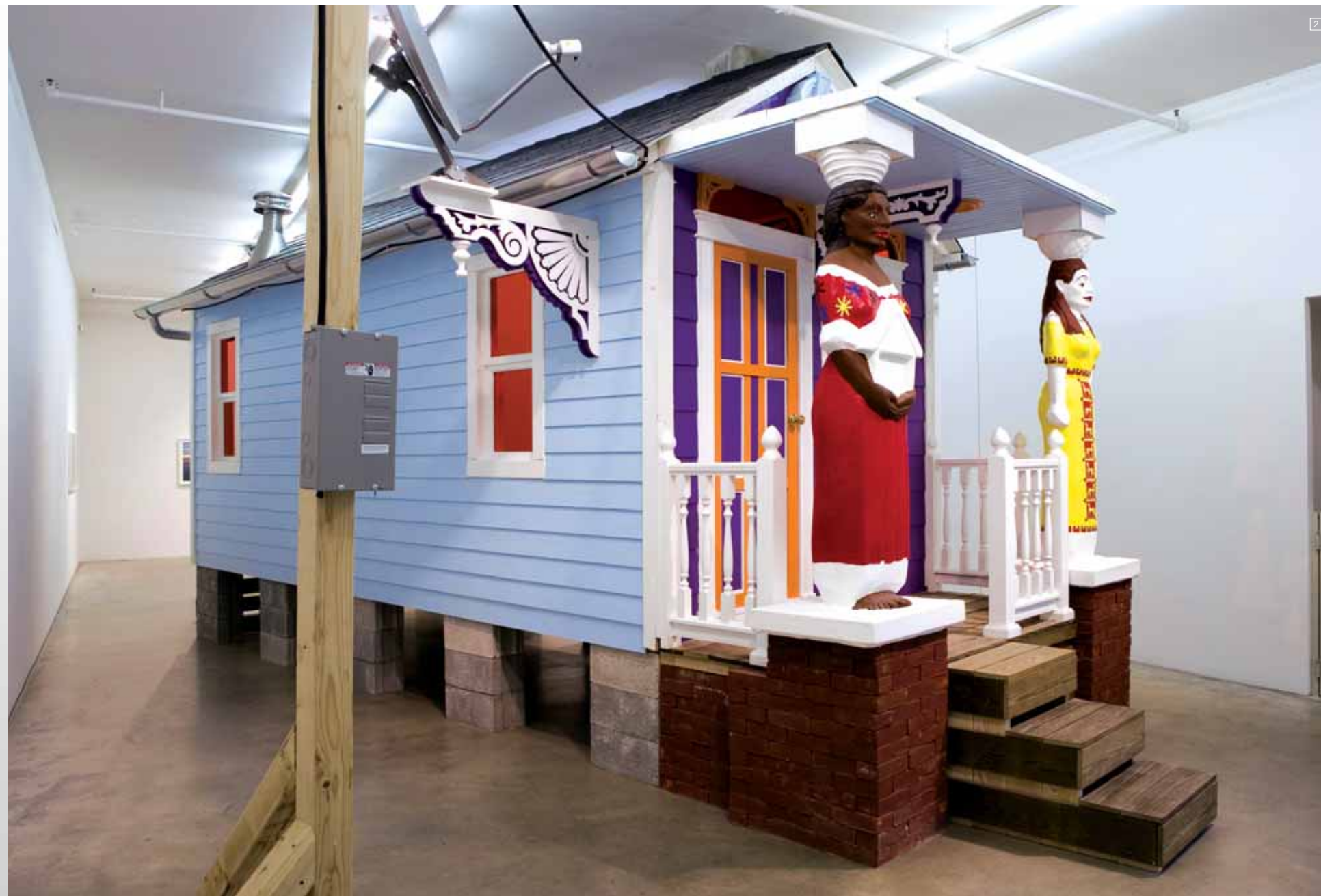
1- Manfred Pernice. "Neue Arbeiten", 2008. Vista de la instalación, Galería Neu, Berlín. 2- Marjetica Potrč. "New Orleans: Shotgun House with Rainwater-Harvesting Tank", 2008. Max Protetch Gallery, New York. 3- Miguel Mitlag. "Plataforma Stripper", instalación en Volumen Abierto, 2006.