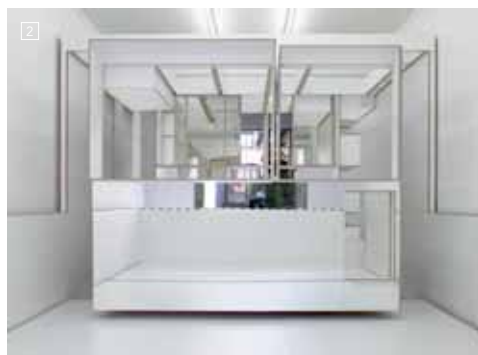
1- Lang / Baumann. "Tubewall", 2008. 2- Jan De Cock. "Denkmal 4, Casa del Fascio, Piazza del Popolo 4, Como", 2006. 3- Tom Sachs. "Unité", 2001. Colección of Solomon R. Guggenheim Museum.

en el escenario de una arquitectura cruda. Allí, los muebles anulados de sus funciones, los materiales reciclados o las fotografías y bocetos que imprime sobre cada uno de estos objetos disparan relatos y experiencias. Tanto del lado de las estrategias de originalidad y funcionalidad arquitectónica como del de la crítica normativa, Marjetica Potrc ha encontrado en el cruce entre observación artística y construcción, los elementos necesarios para elaborar una serie de proyectos modulares e investigaciones materiales cuyo aspecto de inmediato nos conecta con esos entornos habitables precarios que se originan de manera espontánea. Potrc los continúa otorgándoles mayor funcionalidad y subrayando su carácter. Una política de las formas. Para Miguel Mitlag la palabra construcción de inmediato sugiere concentración espacial y diversas escalas de volúmenes, ya que lo que allí se coloca determina los pasos a seguir. Como si se tratara de una partitura o de las indicaciones de un camino, los modelos tridimensionales (una bolsa de supermercado, una caja de zapatillas) y los espacios escultóricos (un escenario para strippers, una habitación) que el artista fabrica, son las pistas de unas narraciones por descubrir. Lang/Baumann revisan esos